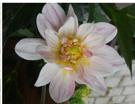
Foton från vårt bostadsområde tagna av Carina Brånemyr & Jeannette Jäde Ezikpe