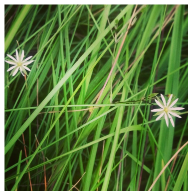
Foton från vårt bostadsområde tagna av Jeannette Jäde Ezikpe.